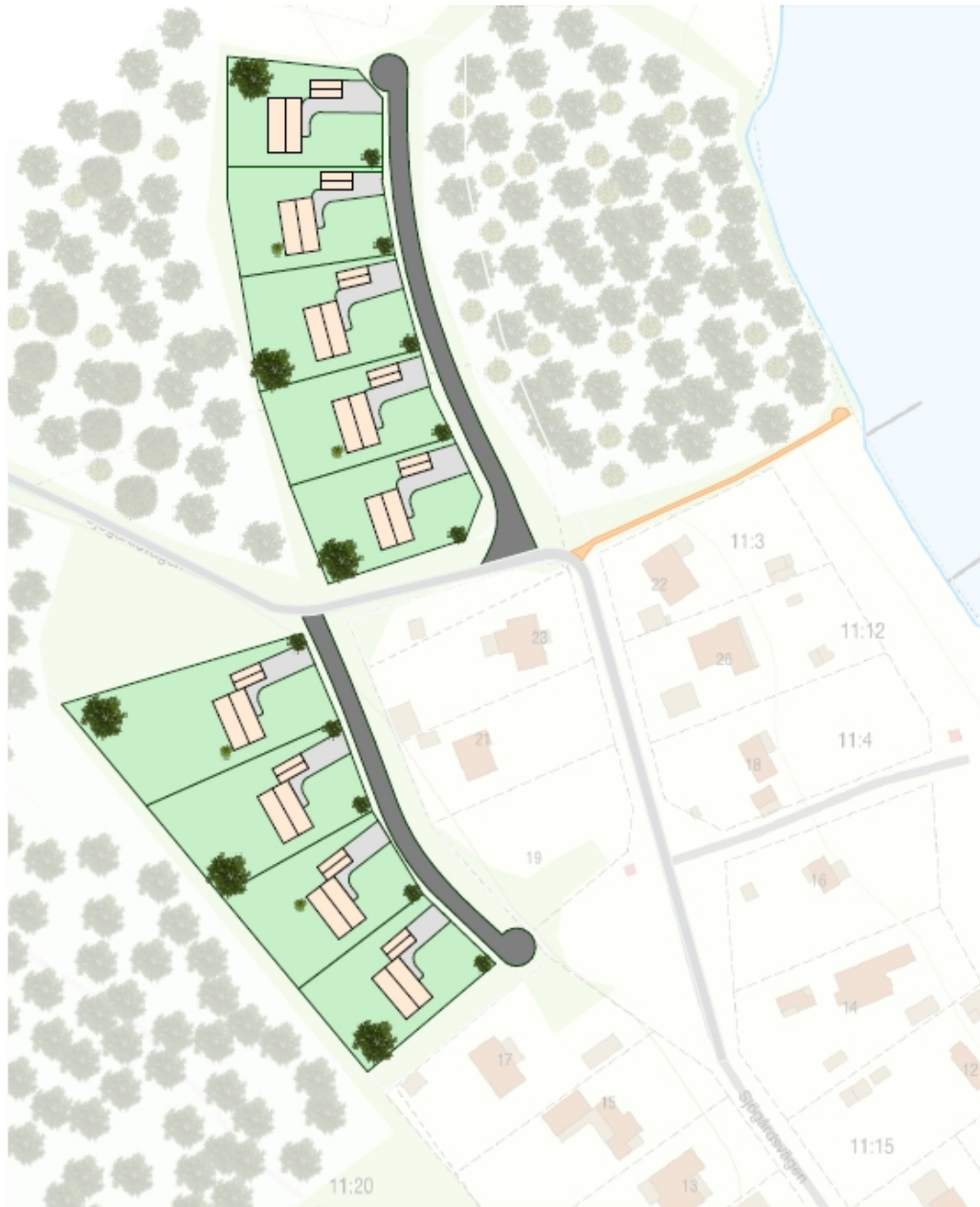
Illustration från sökande: Förslag på villabebyggelse vid Toftasjön